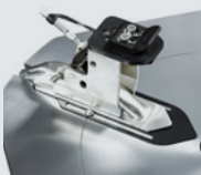
Set di 4 griffe per ruote moto con cerchi da 6"-23"