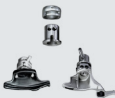
Sistema di cambio rapido testina, composto da adattatori e 2 testine di montaggio (una in plastica e una per razze sporgenti)