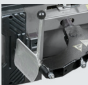
Paletta stallonatore per ruote moto

Versione motore trifase : 0.8 - 1.1 kW 400V/50-60 Hz/3ph (2 speed) - 7-14 rpm