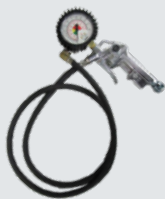
Pistola di gonfiaggio