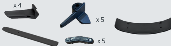
Set di protezioni in plastica