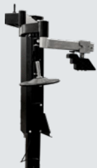
HPX-5 (per Megamount15)