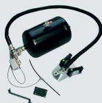
Befüllungs-Kit (nür in der Version mit Fußpedalbefüllung verfügbar)